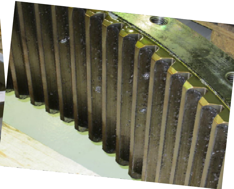
Daraus resultierender Folgeschaden am Hohlrad (Durchläufer)