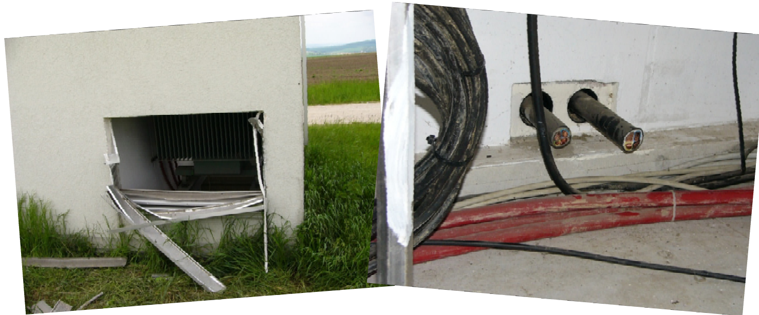
Einbruch und anschließender Kabeldiebstahl