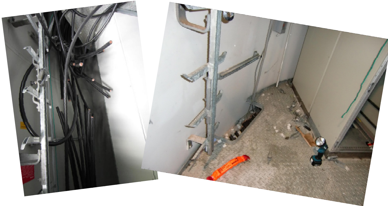
Einbruch und anschließender Kabeldiebstahl