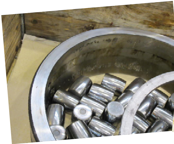
Laufbahnschälungen am Planetenlager durch betriebsbedingte Abnutzung...