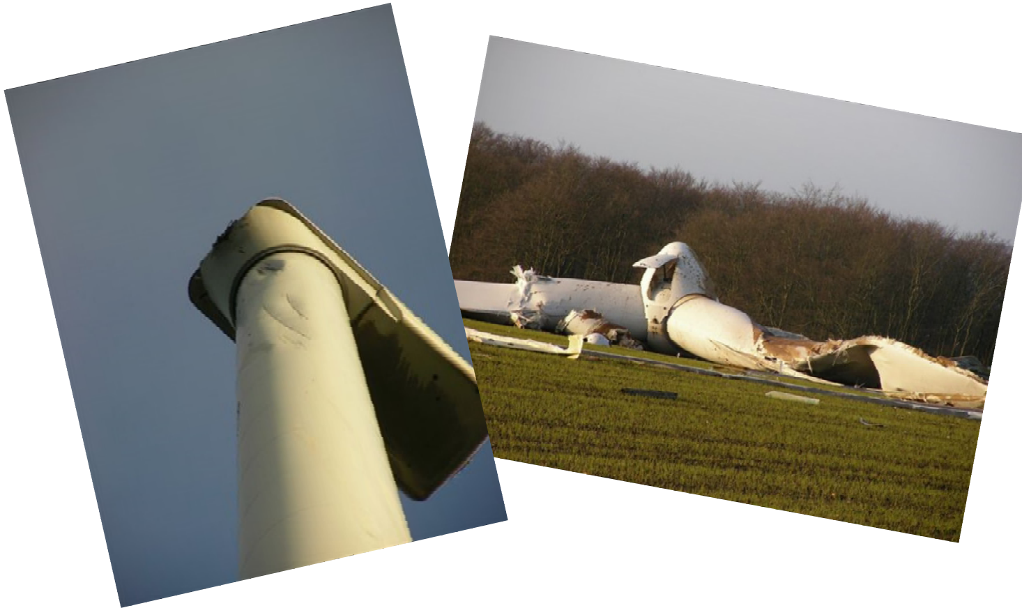
Blitzschlag und daraus resultierende Unwucht